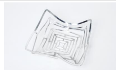
〈代表作品〉 KAGO スクエア L