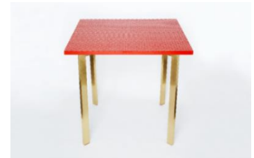
〈代表作品〉 テーブル／ubushina