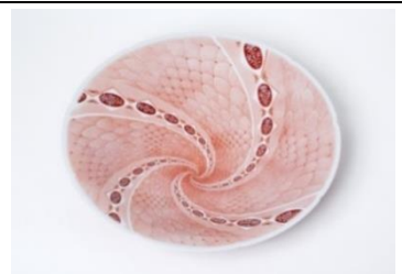
〈代表作品〉 赤絵網手台皿