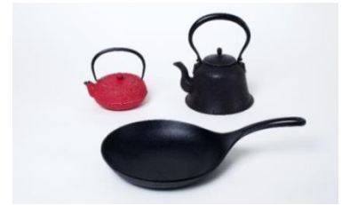
〈代表作品〉 急須 格子アラレ (左)、平底撫肩鉄瓶 1L (右)、 オムレット 24cm (下)