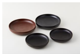
〈代表作品〉 蒔地小福皿、千すじ小福皿