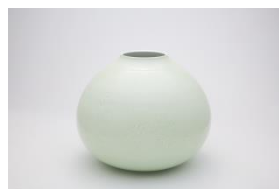
〈代表作品〉 黄磁釉 花瓶(菊)