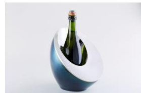
〈代表作品〉 鉋起和器 MOON