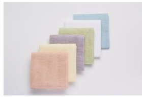
〈代表作品〉 花ふきん